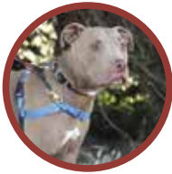
Pit Bull Terrier