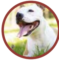
American Staffordshire Terrier