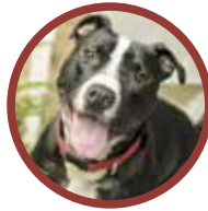
Staffordshire Bull Terrier