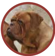
Dogo de Burdeos